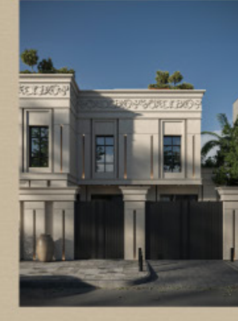
واجهات فيلل سكنية