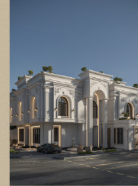
واجهات فيلل سكنية