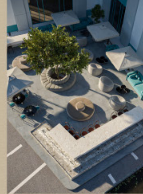
كافية ديكور داخلي