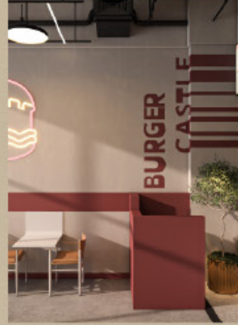
مطعم برجر كاسل