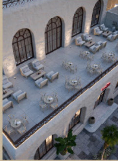
كافية ديكور داخلي